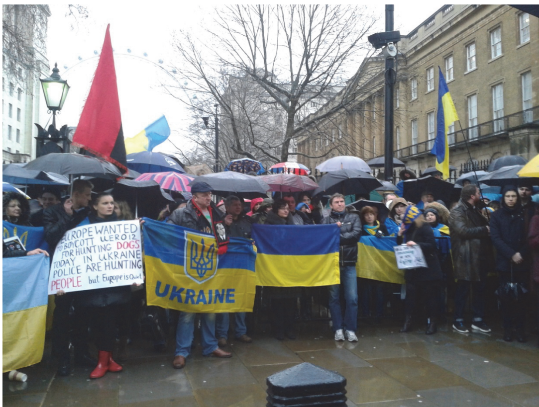
Январь 2014 г. Протест на Даунинг стрит. На другой стороне улицы передают петицию Дэвиду Камерону.

поддержали протест – по крайней мере, на словах), а также собрали более 6500 подписей под петицией, переданной Камерону 11 .