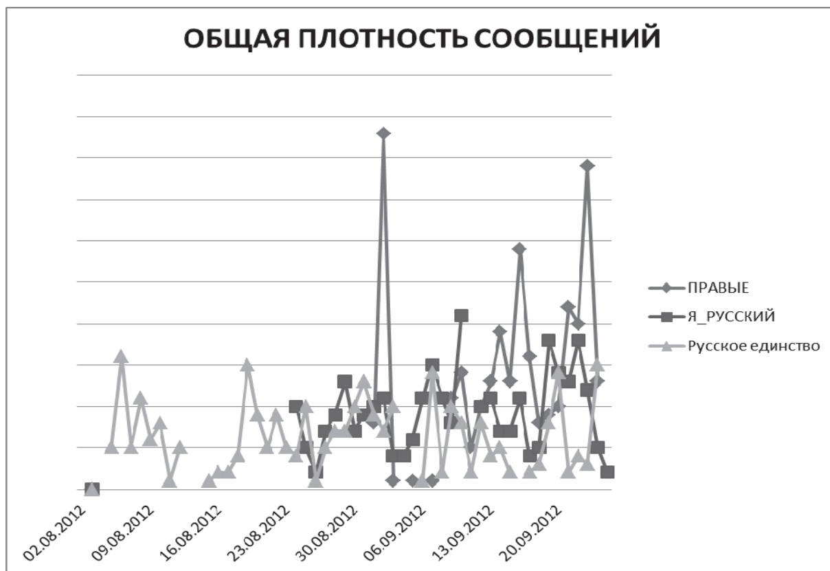
Рис. 2. Плотность сообщений в группах националистов ВКонтакте